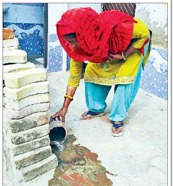
रेवाड़ी। लार्वा मिलने पर बर्तन का पानी खाली करती स्वास्थ्यकर्मी।

डेंगू एडीज मच्छर के काटने से होता है। यह मच्छर दिन में काटता और स्थिर एवं साफ पानी में पनपता है। तेज बुखार, बदन, सिर एवं जोड़ों में दर्द, आंखों के पीछे दर्द, त्वचा पर लाल धब्बे या चकते का निशान, नाक-मसूड़े से या उल्टी के साथ रक्त स्राव और काला पेशाब होना डेंगू के लक्षण हैं। मलेरिया में मरीज के सिर दर्द होना, शरीर में कंपन, ठंड लगना, थकान, बुखार आना, उल्टी होना, जी मिचलना, चक्कर आना प्रमुख कारण हैं। इन लक्षणों के साथ यदि तेज बुखार हो तो अपना इलाज कराएं।