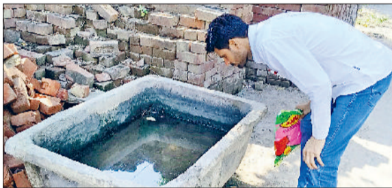
रेवाड़ी। पशु खेल में लार्वा की जांच करते हुए स्वास्थ्यकर्मी।

सितंबर माह में 97 व अक्टूबर माह में अब तक 58 डेंगू पॉजिटिव मरीज मिले हैं। डेंगू मामलों के तेजी से बढ़ने का कारण फोगिंग कार्य में सुस्ती व लोगों की लापरवाही भी है। डेंगू की रोकथाम के लिए स्वास्थ्य विभाग की टीमों घर-घर जाकर लोगों को जागरूक करने के साथ कूलर, फ्रिज, पानी की टंकी, गमले, पशु खेल व आसपास जमा पानी की जांच कर रही है। लार्वा मिलने पर लोगों को नोटिस भी दिए जा रहे हैं। अब तक लार्वा मिलने पर 3689 लोगों को नोटिस दिए जा चुके हैं। स्वास्थ्य विभाग की एमपीएचडब्ल्यू व वीडिंग चेकर टीम अब तक सोर्स रिडिक्शन एक्टिविटी के तहत 2034587 घरों में लार्वा की जांच कर चुकी है।