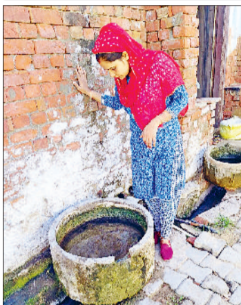
रेवाड़ी। पशु खेल में लार्वा की जांच करते हुए स्वास्थ्यकर्मी।

गत वर्ष अक्टूबर में आए थे 173 केस, इस बार अब तक 58 डेंगू मरीज मिलने पर भी कुल मरीजों की संख्या ज्यादा