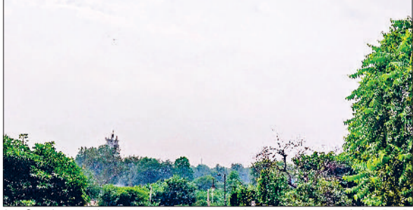
रेवाड़ी। सोमवार को सुबह शहर में छाप बरसत के बाद।

दिन के तापमान में भी कमी आ गई। इसे ठंड की शुरुआत का संकेत माना जा रहा है। रात का तापमान पहले ही सामान्य से कम चल रहा है, जो मौसम में बदलाव के साथ बढ़ना शुरू हो गया है। सोमवार को अधिकतम तापमान 27 डिग्री और न्यूनतम तापमान 10.5 डिग्री सेल्सियस दर्ज किया गया। बादल छाने के साथ ही आसमान में सुबह से ही धुआं की परत बनी रही। इससे आंखों में जलन और दमा रोगियों को सांस लेने में परेशानी का सामना करना पड़ा। एक्यूआई में ज्यादा वृद्धि दर्ज नहीं की गई, परंतु मौसम इसी तरह बना रहा तो यह काफी बढ़ सकता है। हवाओं गति 10