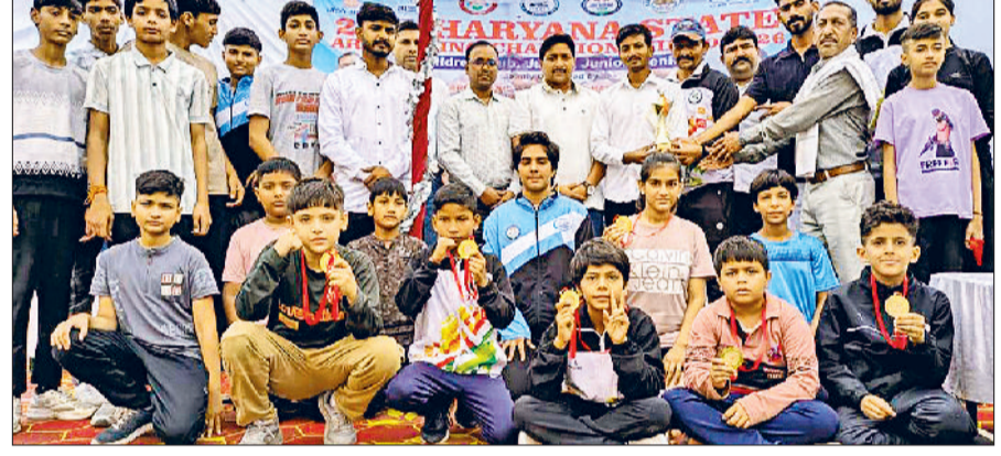
नारनौल। समापन पर पदक विजेताओं को सम्मानित करते हुए।

आंदोलन को तेज किया जाएगा। जिसमें महेंद्रगढ़ शहर की जल व मूल व्यवस्था को बंद करने के लिए संगठन को मजबूर होना पड़ सकता है। जिसकी तमाम जिम्मेवारी कार्यकारी अभियंता व तीनों उपमंडल अभियंताओं की होगी।