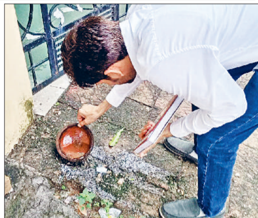
रेवाड़ी। पशु खेल में लार्वा की जांच करते हुए स्वास्थ्यकर्मी।