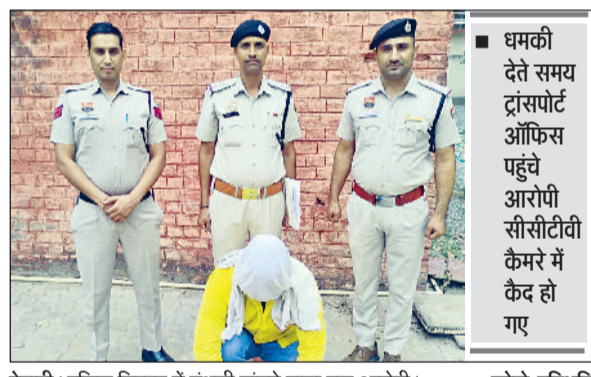
रेवाड़ी। पुलिस गिरफ्त में मंथली मांगने वाला एक आरोपी।