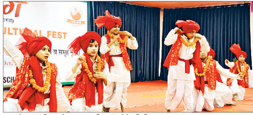
4 नारनौल। सांस्कृतिक कार्यक्रम प्रस्तुत करती छात्राएं।