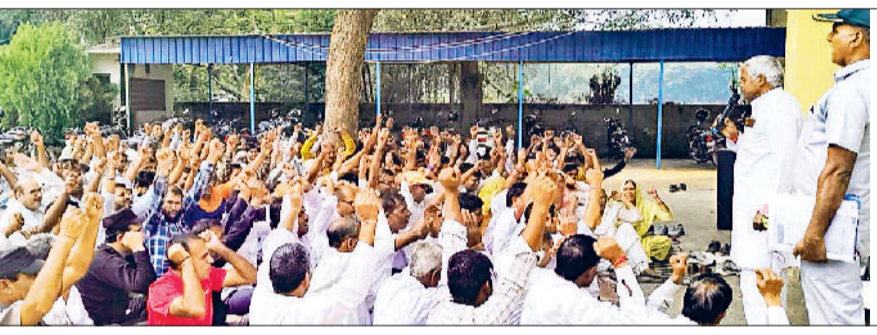
महेंद्रगढ़। कर्मचारियों को संबोधित करते यूनियन के पदाधिकारी।